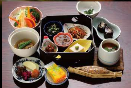
精進朝食 Traditional ascetical breakfast