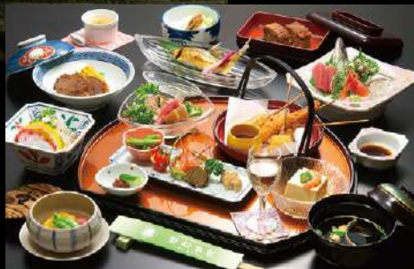
夕食 Japanese kaiseki meal with eel dish