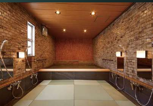
和の湯 Japanese-style public bath (男湯) (Men's bath)