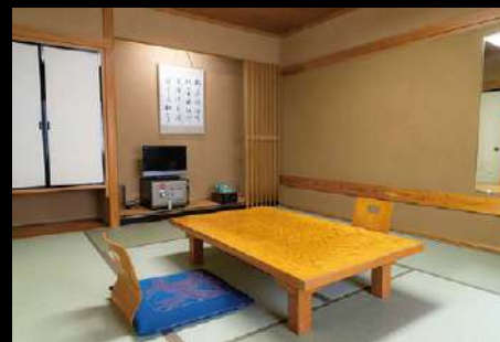
レトロ和室 Retro Japanese style room