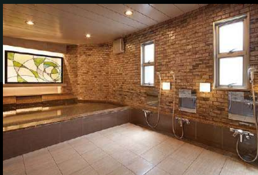
洋の湯 Japanese-style public bath (女湯) (Woman's bath)