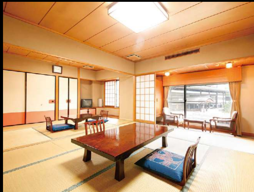
デラックス和室 Deluxe Japanese style room (成田山眺望) (View of temple)