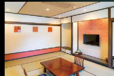
モダン和室 Modern Japanese style room (成田山眺望) (View of temple)